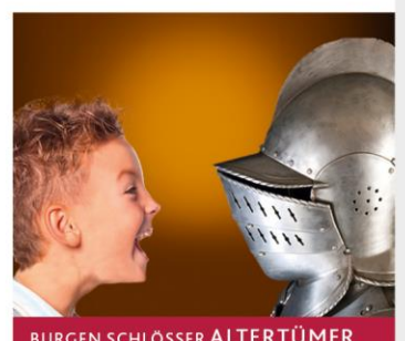
BURGEN SCHLÖSSER ALTERTÜMER